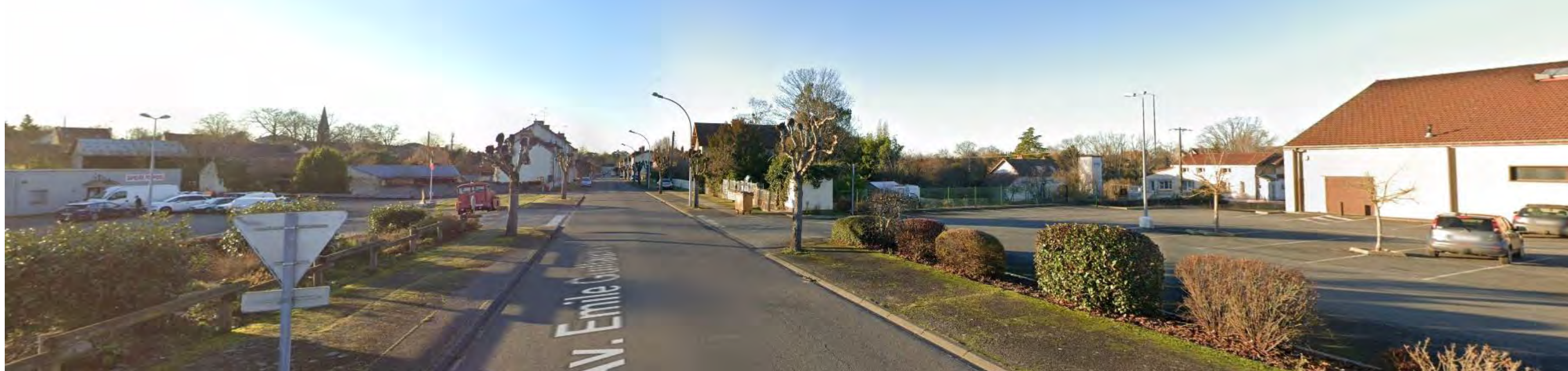
Vue 1 : depuis l'avenue Emile Guillaumin , est du site Prise de vue : 08/2019