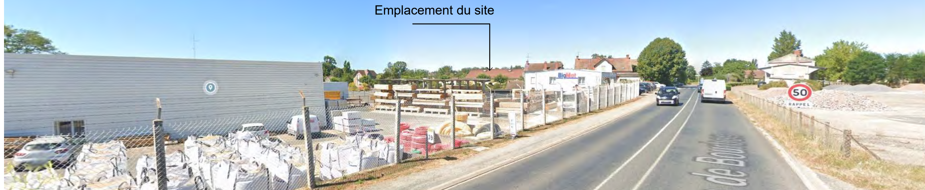
Vue 4 : depuis RD 953 , nord-est du site Prise de vue 08/2022