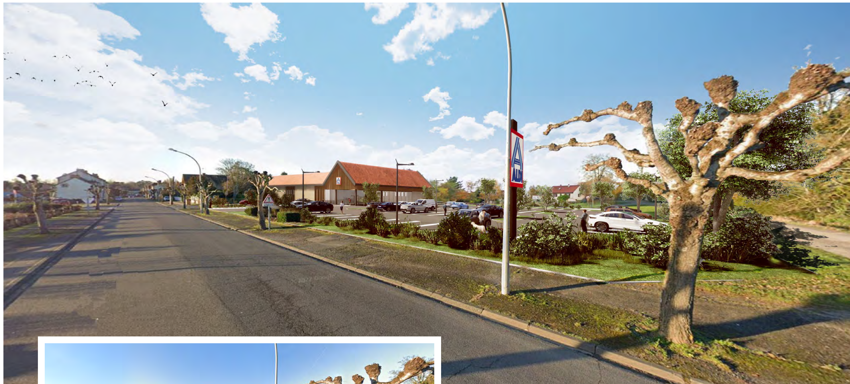
Vue Sud-Est du projet